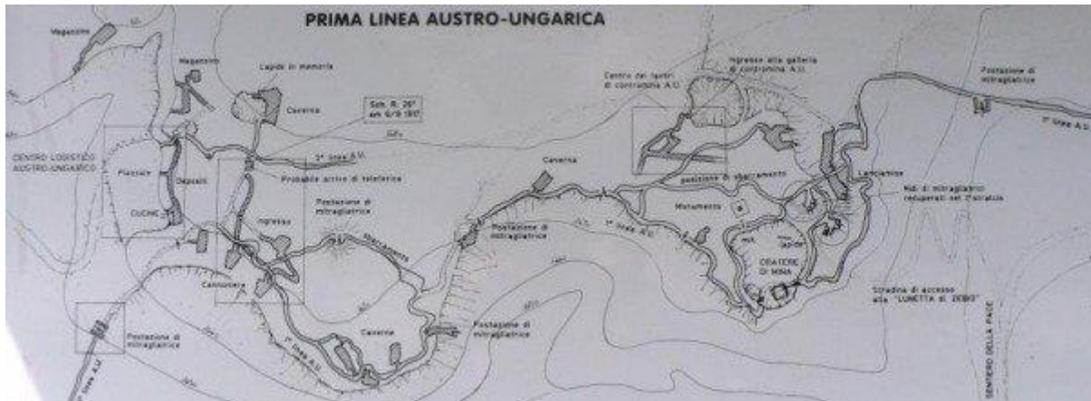
Průběh rakousko-uherské první linie